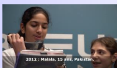
Conseil des élèves FL