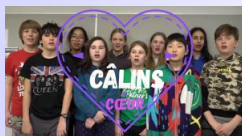
Conseil des élèves Pointe-Claire