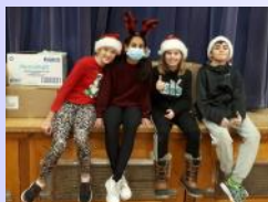
Conseil des élèves Pointe-Claire

Quelques projets porteurs ont été poursuivis en coopération avec les directions des écoles concernées et ont été particulièrement appréciés.