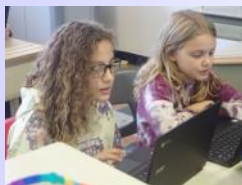
Journal des élèves Gentilly

Une fois par mois, une petite équipe d'élèves de 4 e à 6 e année a élaboré et réalisé des projets d'engagement avec grand enthousiasme.